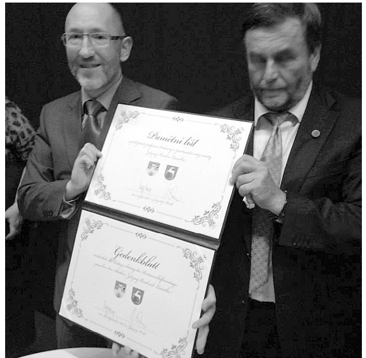
Bürgermeister der Stadt Lauscha Norbert Zitzmann und Bürgermeister von Zelesny Brod Mgr. Frantisek Lufinka

Zu diesem Anlass wurde der Städtepartnerschaftsvertrag zwischen Zelezny Brod und Lauscha im Rahmen eines Festaktes unterzeichnet.