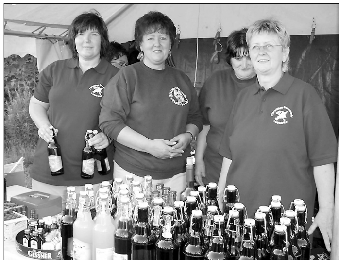
Erfrischende Getränke gab es bei den Frauen vom Feuerwehrverein

„Dass sich die gesamte Einsatzabteilung und alle Vereinsmitglieder bereitwillig einbringen bei der Vorbereitung und Durchführung dieser Veranstaltung, die jedes Jahr mehr Interessenten verzeichnet.“