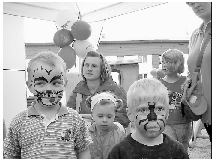
Andrang herrschte auch beim Kinderschminken